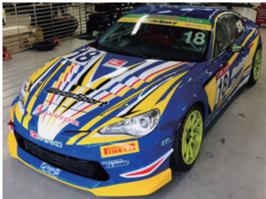
18 PIRELLI SUPER TAIKYU SERIES 2019, ST4 CLASS WedsSport 86

チーム監督は浅野真吾監督。ドライバーには長年日本のモータースポーツで活躍しているレジェンド・浅野武夫選手、チーム3年目の井上雅貴選手、さらに19歳期待のヤングドライバー・藤原大暉選手を迎え、磐石の体制でシリーズチャンピオン獲得を目指します。